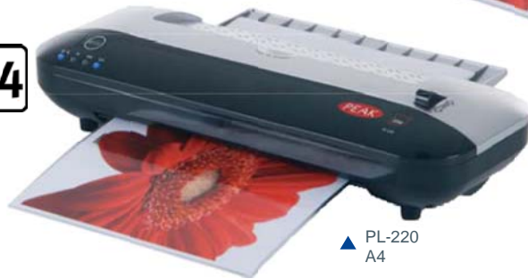
▲ PL-220 A4