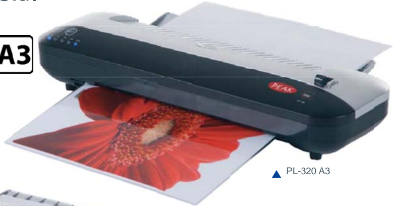
▲ PL-320 A3